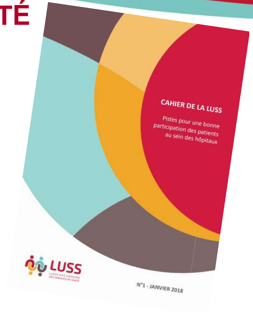
Cahier de la LUSS « Piste pour une bonne participation des patients au sein des hôpitaux »